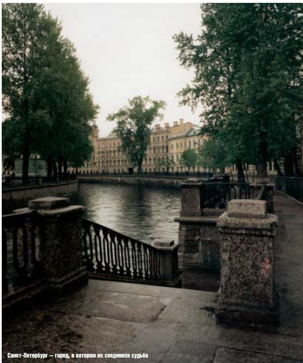
Санкт-Петербург — город, в котором их соединила судьба

30 октября Анна закончила стенографировать «Игрока» и последние страницы «Преступления и наказания». Достоевский через полицию вручил «Игрока» нечистоплотному издателю. Другого выхода не было —