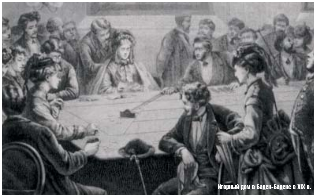
Игорный дом в Баден-Бадене в XIX в.

Бог мой — так это так! Обожаю каждый атом твоего тела и твоей души, и целую всю тебя, всю...»