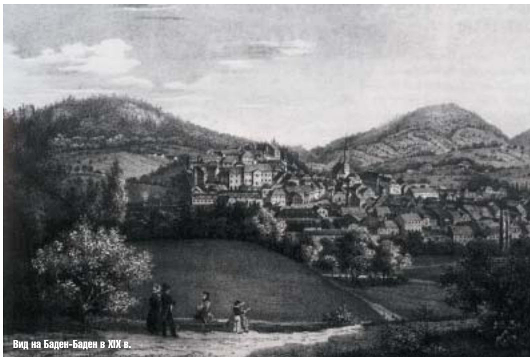
Вид на Баден-Баден в XIX в.

4 декабря 1867 года Анна Григорьевна делает в дневнике такую запись: «Ходила закладывать два шелковых платья, получив деньги, сказала, что будто бы это прислала мне мама...»