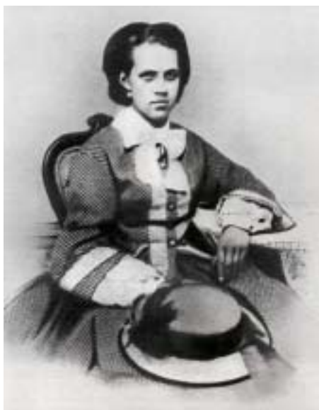
А.Г. Достоевская. 1860-е годы

дор Михайлович был чрезвычайно оживлен и что-то интересное рассказывал моей сестре. Вдруг он прервал на полуслове свою речь, побледнел, привстал с дивана и начал наклоняться в мою сторону. Я с изумлением смотрела на его изменившееся лицо. Но вдруг раздался ужасный, нечеловеческий крик... Впоследствии мне десятки раз приходилось слышать этот «нечеловеческий» вопль, обычный у эпилептика в начале приступа. И этот вопль меня всегда потрясал и пугал. Но тогда, к моему удивлению, я несколько не испугалась, хотя видела припадок эпилепсии первый раз в жизни...».