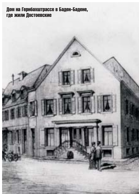
Дом на Гернбахштрассе в Баден-Бадене, где жили Достоевские

«Анька, идол мой, милая, честная моя... не забудь меня. А что идол мой,