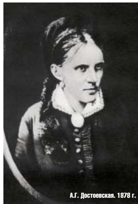
А.Г. Достоевская. 1878 г.

«Прошло недели три нашей дрезденской жизни, — пишет Анна Достоевская, — как однажды муж заговорил о рулетке (мы часто с ним вспоминали, как вместе писали роман «Игрок») и высказал мысль, что если бы в Дрездене он был теперь один, то непременно бы съездил поиграть на рулетке... Я